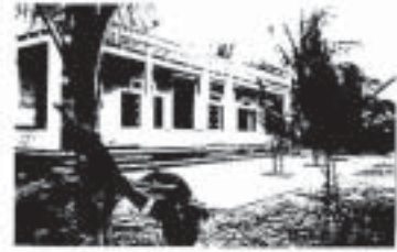
Trường THPT Trần Hưng Đạo xây tại vùng biên giới

Trường Thạch Bích và Đá Hàn vừa được xây cất - đáp ứng nhu cầu cấp bách giáo dục tuổi trẻ tại các vùng hẻo lánh xa xôi của miền Trung, sau cơn lũ lụt cuối năm 1999.