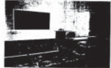
Em gái Anna Mỹ

Quý Cổ Động & Yểm Trợ Giáo Dục LaSan tại Việt Nam tiếp tục cấp học bổng cho các em học sinh nghèo, và nuôi dưỡng & huấn luyện các thanh niên nam nữ nhiệt tâm hiến dâng đời mình cho tuổi trẻ trong ngành giáo dục.