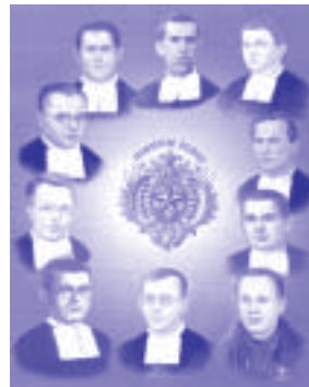
các thánh tử đạo thành Asturias