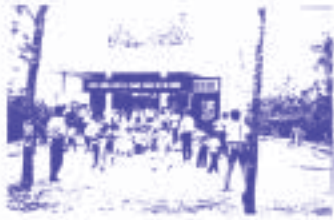
Trường Thạch Bích và Đá Hàn vừa được xây cất - đáp ứng nhu cầu cấp bách giáo dục tuổi trẻ tại các vùng hẻo lánh xa xôi của miền Trung, sau cơn lũ lụt cuối năm 1999.