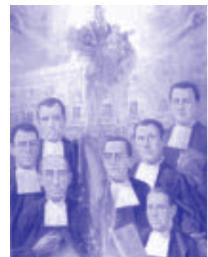
các chân phước tử đạo thành Almería