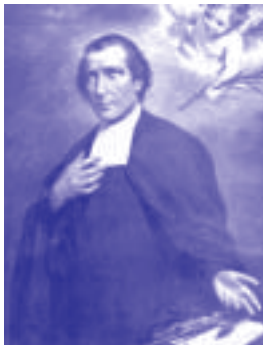
Salomon, tử đạo