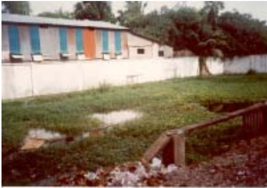
hồ tắm tại trường La San Mossard biến thành ... (?) sau 1975