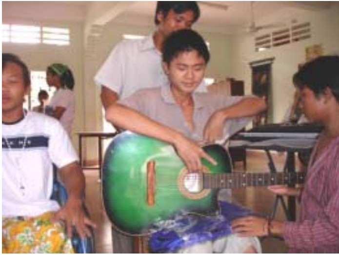
Các em mồ côi, mù, què... vui sướng được Anh Chị Em Lasan viếng thăm