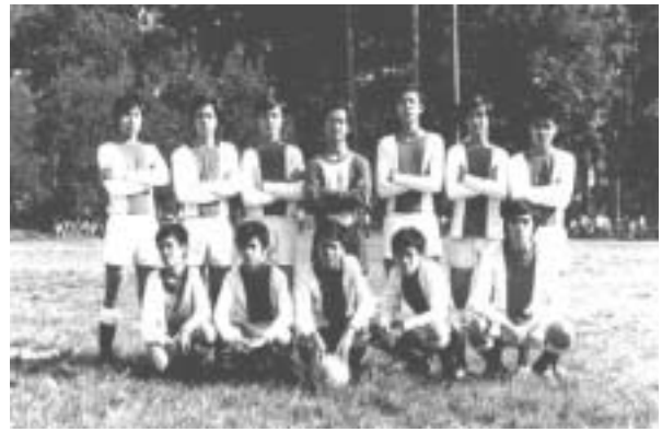
một đội bóng tròn - La San Mossard trước 1975

Trước 1975, mỗi cơ sở giáo dục của La San đều có ít nhất là một sân bóng rổ và bóng chuyền. Một vài trường như Bình Linh, Mossard, Cần Thơ, v.v... còn có thêm sân bóng tròn - sau này gọi là bóng đá, hoặc hồ bơi thích hợp cho các bộ môn thể thao, thể dục.