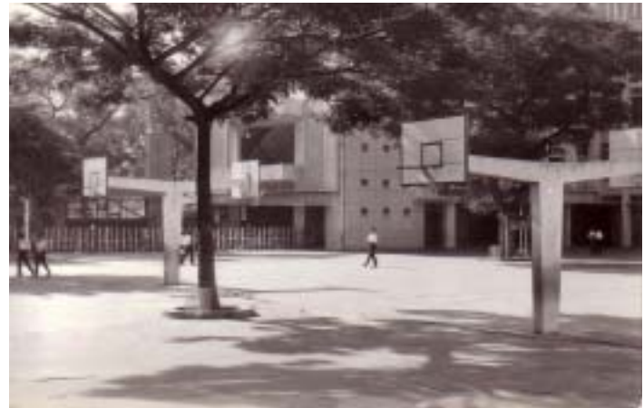
dãy sân bóng rổ tại trường La San Taberd trước 1975

Sau 1975, trường ốc không còn thì nói gì đến các phương tiện thể dục thể thao ?